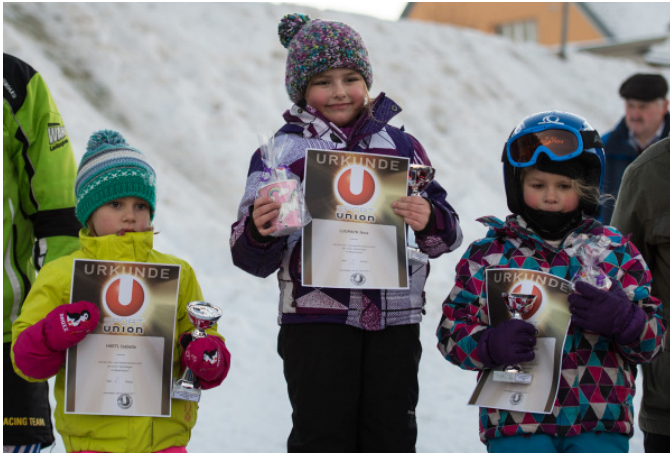
Die Siegerehrung Das Brot jedes Rennläufers