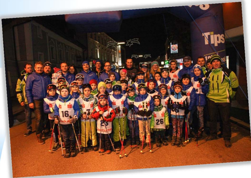
Einmarsch der Strudengaucup Kids mit Weltmeister Manfred Pranger