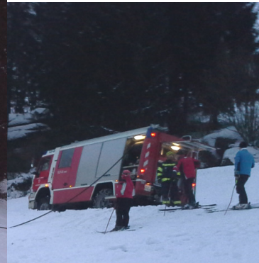
Vorbereitung der Rennstrecke

Die „Streif des unteren Mühlviertels“ von vielen genannt, nach 6 Saisonen wieder in Originallänge