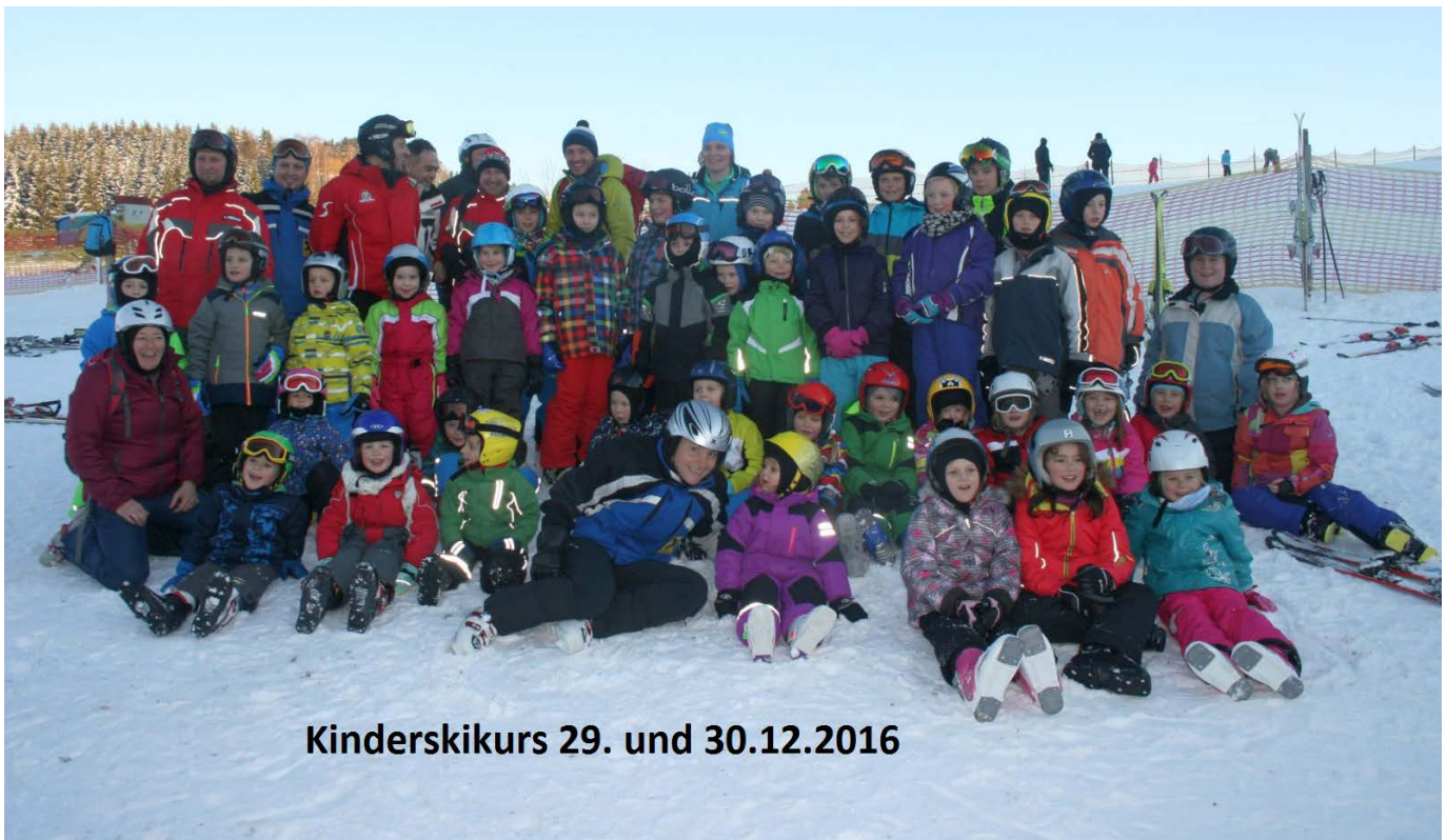
Kinderschikurs 29. und 30.12.2016

Dank des schneereichen Winters konnte unser Kinderschikurs am 29. und 30. Dezember bei perfekten Bedingungen am Schorschi Schilift in St. Georgen/W. durchgeführt werden. Alle 35 Teilnehmer von 3 ½ bis 12 Jahren waren mit Begeisterung dabei und machten große Fortschritte.