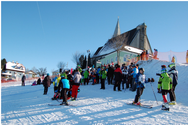
Benedikt Moser Auf dem Weg zur Tagesbestzeit